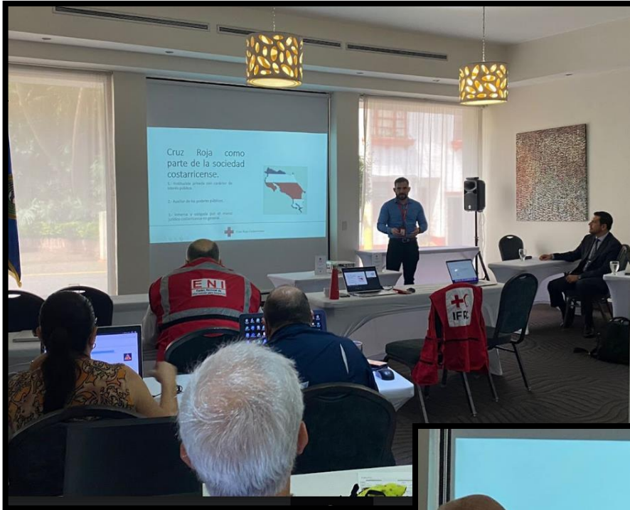
22 de julio de 2022, Presentación Rol de Auxiliadad, Cruz Roja Costarricense