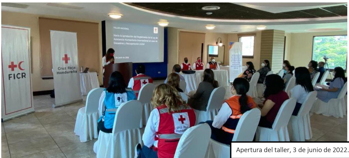
Apertura del taller, 3 de junio de 2022.