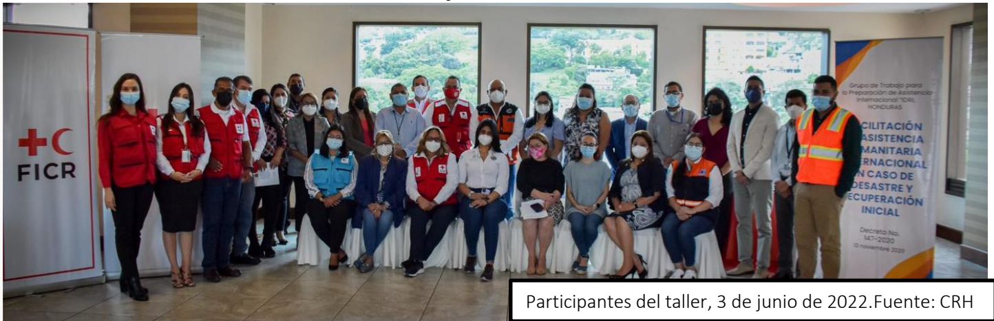
Participantes del taller, 3 de junio de 2022.