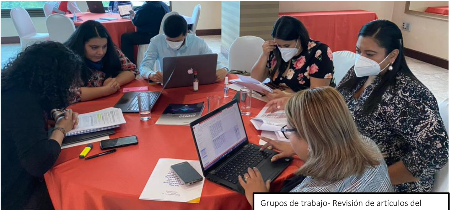
Grupos de trabajo- Revisión de artículos del Reglamento por área, 3 de junio de 2022.