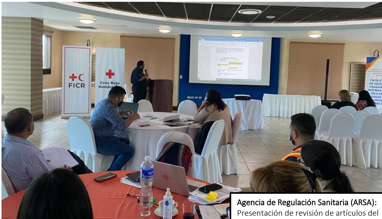
Agencia de Regulación Sanitaria (ARSA): Presentación de revisión de artículos del Reglamento por área, 3 de junio de 2022.