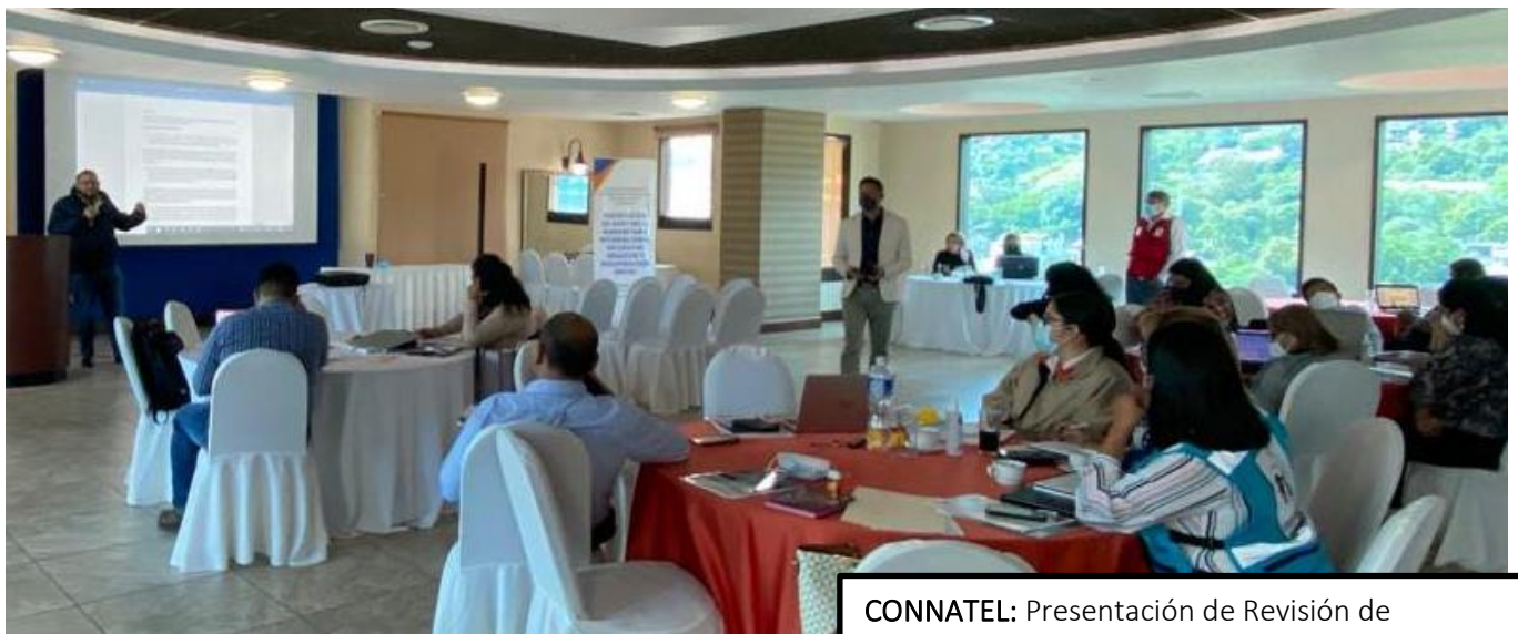
CONNATEL: Presentación de Revisión de artículos del Reglamento por área, 3 de junio de 2022.