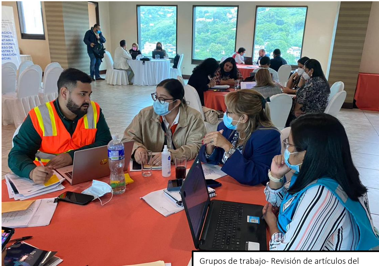
Grupos de trabajo- Revisión de artículos del Reglamento por área, 3 de junio de 2022.