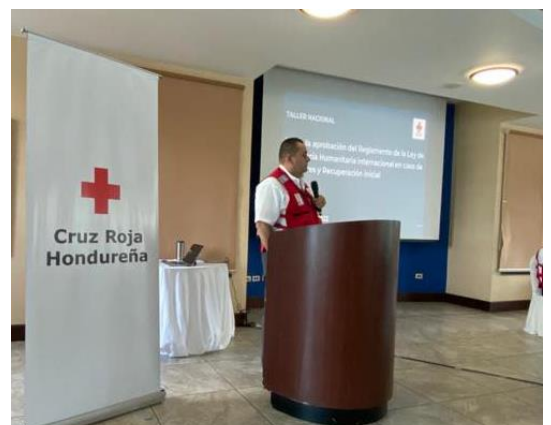
Representantes de COPECO y Cruz Roja Hondureña, Palabras de bienvenida, 3 de junio de 2022.