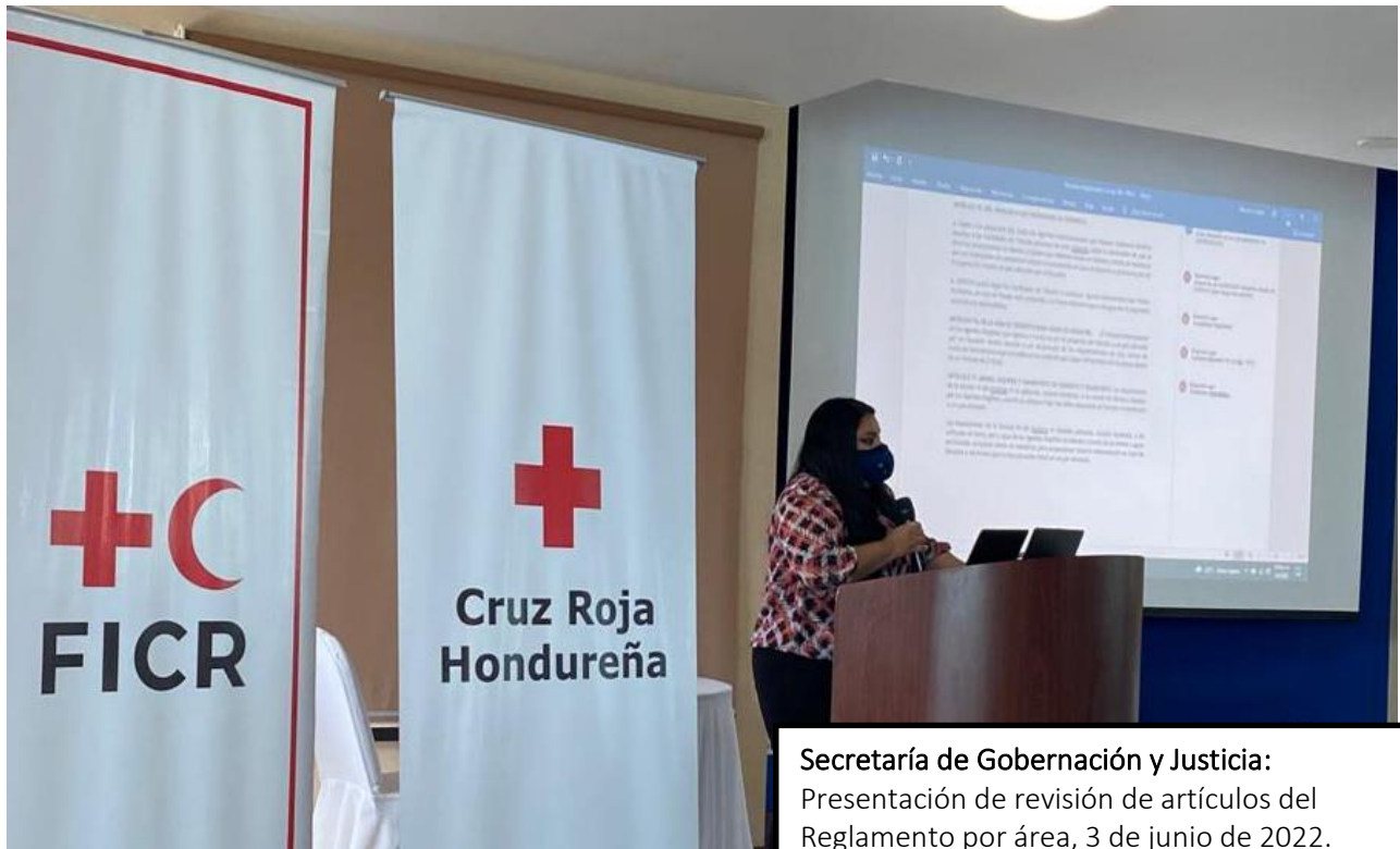
Secretaría de Gobernación y Justicia: Presentación de revisión de artículos del Reglamento por área, 3 de junio de 2022.